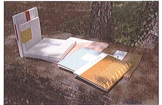
創作本、装幀本の数々

掌ほどの大きさの紙片の中に広がる、山室眞二の豊かな世界をこの機会にご覧ください。